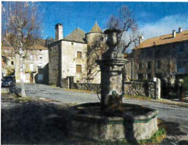
Manoir et fontaine à Chambon